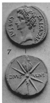
2. Denier – Espagne 18-17 av. J.-C. BMC I, pl. 6, et p. 59