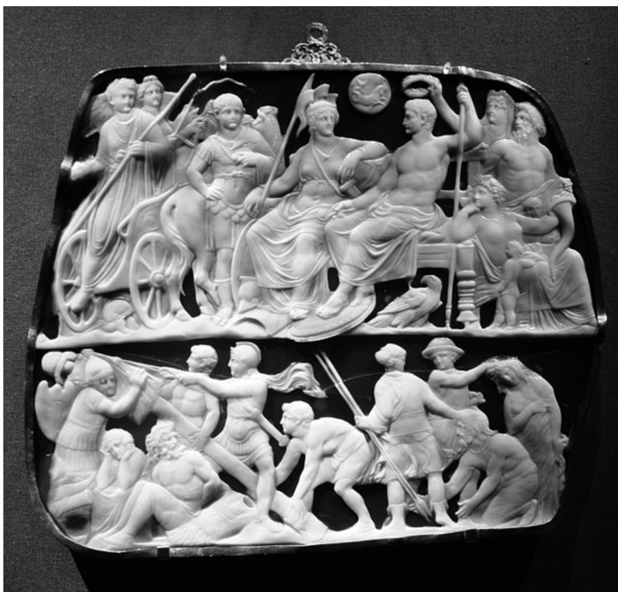
Figure 2 : Gemma Augustea.

Quelles raisons pouvait donc avoir Octave de préférer le Capricorne à son signe de naissance, la Balance ? Sur les documents figurés 70 , les représentations de la constellation zodiacale ne sont pas conformes à l'imagerie traditionnelle : le Capricorne est figuré comme un animal hybride, mi-terrestre mi-marin – peut-être sous l'influence des Chaldéens car, dans l'uranographie babylonienne, un poisson-chèvre occupait dans le zodiaque la place correspondant au Capricorne. Cet étrange animal, par sa dualité, symboliserait mieux qu'un autre la paix « obtenue sur terre et sur mer » qu'évoque Auguste dans ses Res Gestae . C'est donc le signe le mieux adapté à un conquérant qui, comme Octave, se pose en pacificateur de