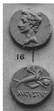
4. & 5. Deniers 22-19 av. J.-C. BMC I, p. 5, 15 & 16 et p. 56