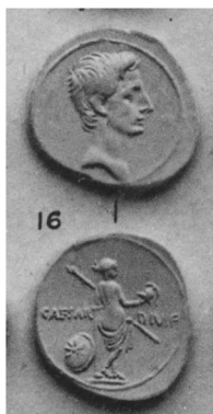
1. Denier – Lyon 31-29 av. J.-C. BMC I, pl. 14, 16 et p. 98